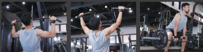
ラットプルダウン